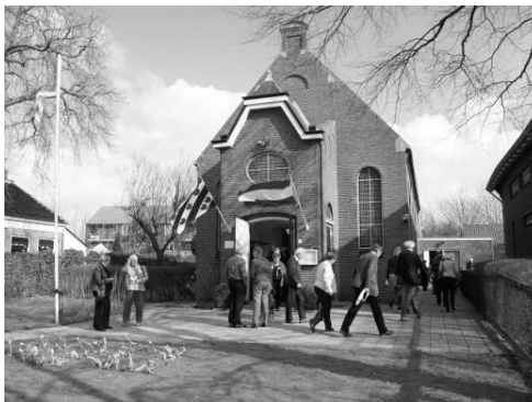
Doopsgezinde Gemeente Hallum