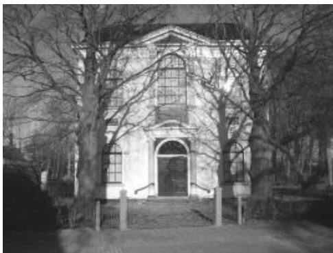
Doopsgezinde Gemeente Holwerd Blija Ternaard