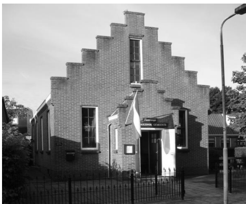
Doopsgezinde Gemeente Stiens